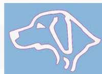
Cut - To - Shape