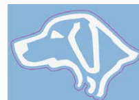
Countour Cut (Clear Vinyl)